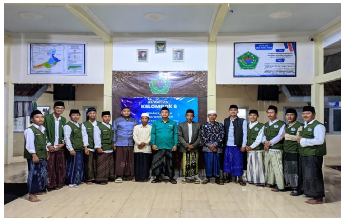
Gambar 03: bersama kepala desa dan tokoh agama desa waru timur

Jika ditinjau secara menyeluruh, program ini berhasil mengintegrasikan tiga ranah utama pendidikan: kognitif, psikomotorik, dan afektif. Peningkatan pemahaman jamaah menunjukkan keberhasilan pada ranah kognitif, perbaikan gerakan salat membuktikan keberhasilan pada ranah psikomotorik, dan penguatan kesadaran spiritual menegaskan keberhasilan pada ranah afektif. Pendekatan semacam ini sejalan dengan pandangan pendidikan Islam yang menekankan pentingnya keselarasan antara ilmu, amal, dan iman. Dengan kata lain, pendidikan agama yang ideal adalah pendidikan yang tidak hanya menekankan pengetahuan atau keterampilan, tetapi juga membentuk kesadaran spiritual yang mendalam.