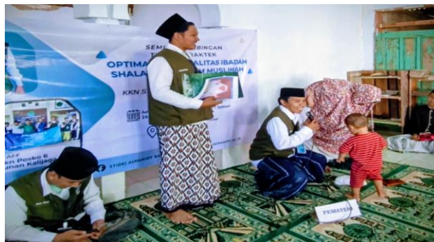
Gambar 02: bimbingan tatacara salat yang benar sesuai anjuran syariat

Secara keseluruhan, program ini menunjukkan bahwa metode partisipatif yang menggabungkan observasi, ceramah interaktif, diskusi kelompok, praktik langsung, dan penguatan spiritual mampu memberikan perubahan nyata terhadap kualitas ibadah salat kaum muslimah di Dusun Kendal. Peningkatan tersebut tidak hanya mencakup aspek pengetahuan dan keterampilan teknis, tetapi juga kesadaran spiritual yang lebih mendalam. Dengan demikian, program ini tidak hanya bermanfaat dalam jangka pendek, tetapi juga memiliki potensi memberikan dampak positif jangka panjang melalui pembiasaan ibadah yang lebih berkualitas. 17