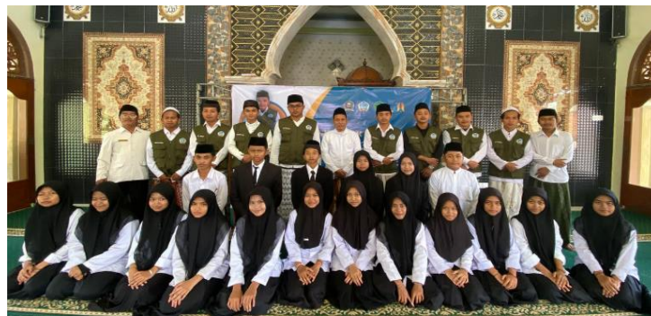
Gambar 3: Puncak pelatihan kepemimpinan bersama guru setempat.

Guru yang terlibat juga mengamati adanya perubahan perilaku siswa selama dan setelah pelatihan. Mereka mencatat bahwa siswa menjadi lebih aktif dalam kegiatan kelas, lebih berani menyampaikan pendapat, serta mulai menunjukkan rasa solidaritas yang lebih tinggi terhadap teman-teman sekelas. Perubahan ini dianggap sebagai tanda keberhasilan pelatihan dalam membangun karakter yang positif. Respon positif dari orang tua juga menjadi indikasi bahwa pelatihan memberikan dampak yang meluas, tidak hanya di lingkungan sekolah tetapi juga di rumah. Orang tua melaporkan bahwa anak-anaknya lebih percaya diri dan mulai menunjukkan sikap kepemimpinan kecil dalam kegiatan sehari-hari, seperti membantu pekerjaan rumah dan memimpin teman sebaya dalam permainan.