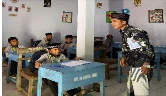
Gambar 2: Materi kepemimpinan.

Para siswa mengenali karakteristik penting seorang pemimpin yang baik, seperti kejujuran, tanggung jawab, kerja sama, komunikasi efektif, serta kemampuan menginspirasi orang lain. Selama pelatihan, siswa diajak untuk mengidentifikasi perbedaan antara memerintah dan menginspirasi. 14 Melalui refleksi dan dialog terbuka, siswa mulai menyadari bahwa kepemimpinan yang efektif bukan sekadar memberi perintah, melainkan mampu membangun kepercayaan dan memberikan contoh nyata. Hasil observasi dan evaluasi kuisisioner menunjukkan bahwa sebanyak 85% siswa kini mampu menyebutkan minimal lima ciri kepemimpinan yang baik, sedangkan sebelumnya kurang dari 20%.