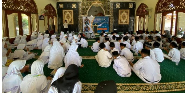
Gambar 2: Simulasi Kepemimpinan.

temannya. Pada sesi “Menjadi Pemimpin Hari Ini”, siswa secara bergiliran memimpin kelompok kecil dalam menyelesaikan tugas atau permainan. Aktivitas ini mendorong siswa untuk belajar menyampaikan pendapat secara jelas, mengatur strategi kelompok, serta memotivasi anggota tim.